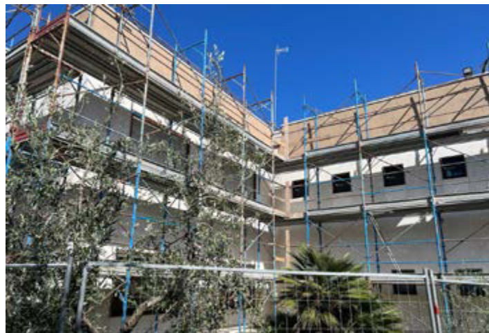
Barletta - Parrocchia San Paolo. Allestimento ponteggio facciate nord della palazzina catechesi

Per quanto riguarda la somma erogata per gli interventi caritativi, per l'anno 2023 si è continuato nel programma