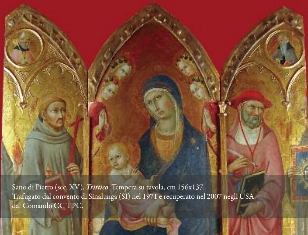
Sano di Pietro (sec. XV), Trittico . Tempera su tavola, cm 156x137.

L'esito di questo lavoro è consultabile online attraverso il portale BeWeb – Beni ecclesiastici in Web, all'indirizzo www.chiesacattolica.it/beweb .